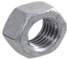
Hot Deep Galvanized