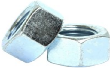
Zinc Plate Coated