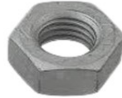
Zinc Flake Coated